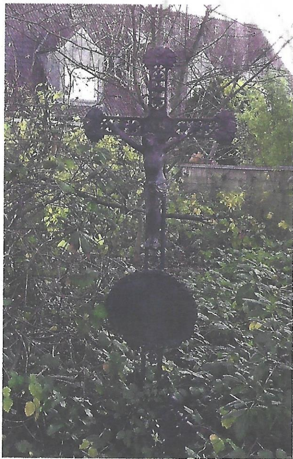
Viele Gräber auf dem alten Friedhof Hoisten wurden schon eingeebnet, zum Teil hat sich Buschwerk breit gemacht. Mit der Entwidmung der Anlage entfällt die letzte Pflegeverpflichtung durch die Friedhofsbetriebe.